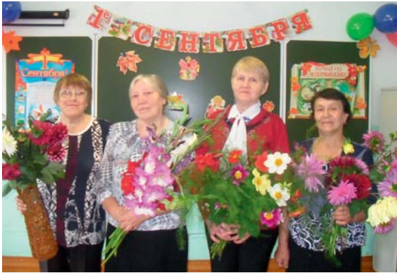
Ветераны педагогического труда Светличанской школы

На пороге осень, сентябрь... А значит начало нового учебного года. Оглядываясь назад, на год прошедший, замечу – он был сложным, но не менее интересным, полным событий и впечатлений.