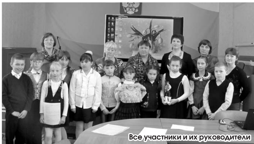
Все участники и их руководители