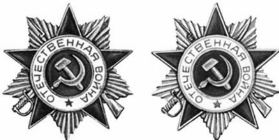
ОРДЕН ОТЕЧЕСТВЕННОЙ ВОЙНЫ

Орден Отечественной войны двух степеней учрежден в мае 1942 года. Им награждались и военачальники, и рядовые воины, а также невоенные люди за вклад в победу.