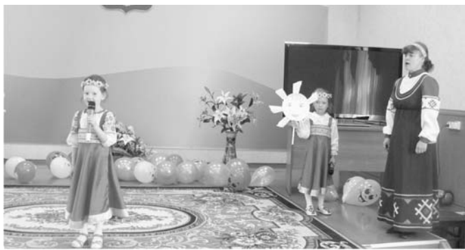
Дипломанты окружного конкурса песенного творчества «Ыбшар» ансамбль «Ен шка» Косинского детского сада №2